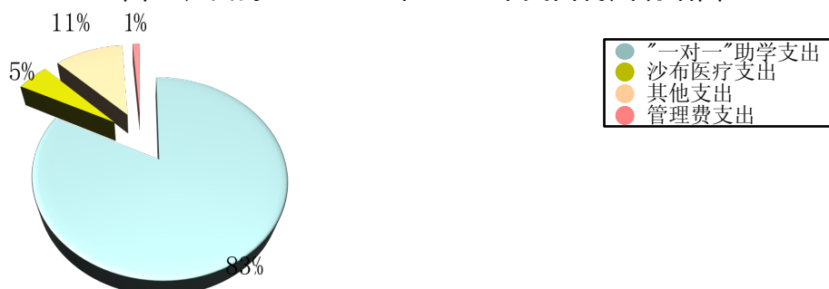
图二、山野基金2004年-2012年支出构成明细图